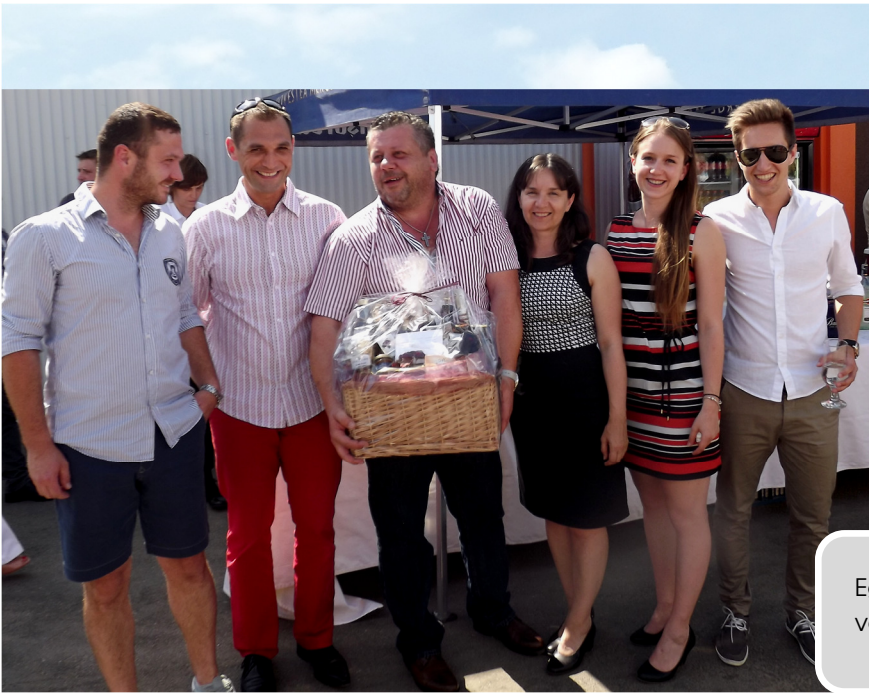
Egy kis köszönet partnercégünkötől, a Pyronovától.